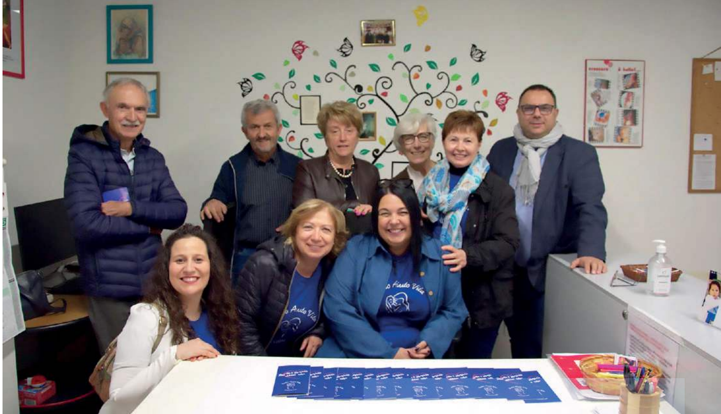
dei Volontari del CAV di Nogara